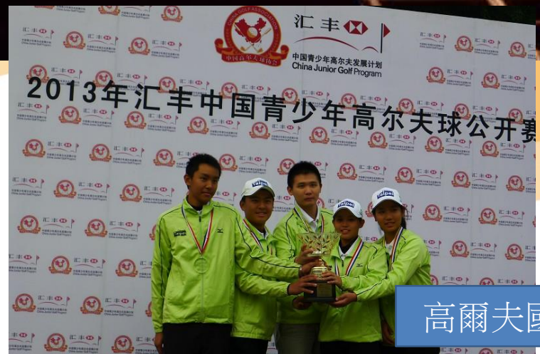
高爾夫國手陳敏柔