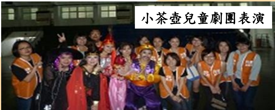
小茶壺兒童劇團表演