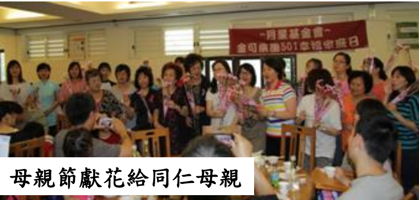
母親節獻花給同仁母親