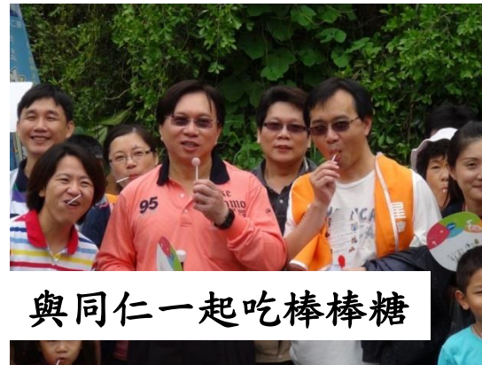
與同仁一起吃棒棒糖