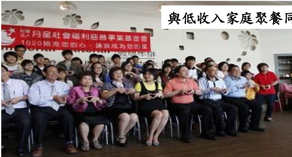
與低收入家庭聚餐同樂